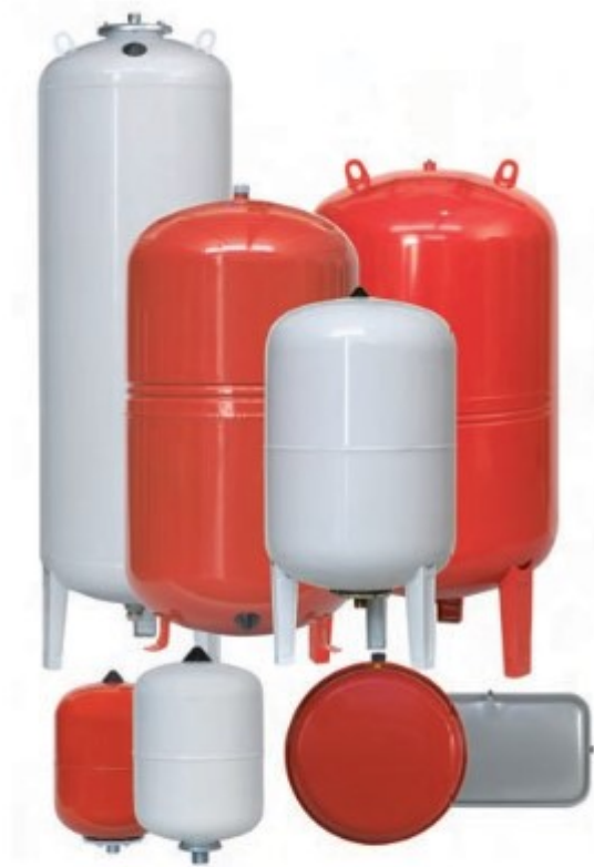
Vasos de expansión